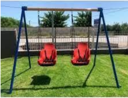
Φωτογραφία 2. Κατάλληλες κούνιες

- Χρειάζονται συνολικά 4 ειδικά καθίσματα για ΑΜΕΑ , τα 2 με ειδική πλάτη και ζώνη και τα άλλα 2 τύπου κούνια ΑΜΕΑ – φωλιά (επισυνάπτονται ενδεικτικά φωτογραφίες 2,3).