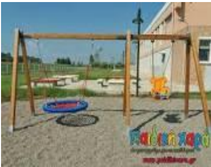
Φωτογραφία 3. Κατάλληλη κούνια

- Η υφιστάμενη τραμπάλα (επισυνάπτεται φωτογραφία 4) είναι ακατάλληλη για παιδιά ΑΜΕΑ , αφού δεν παρέχει καμία προστασία. Θα πρέπει να αντικατασταθεί από ειδική τραμπάλα για ΑΜΕΑ (επισυνάπτεται ενδεικτική φωτογραφία 5)