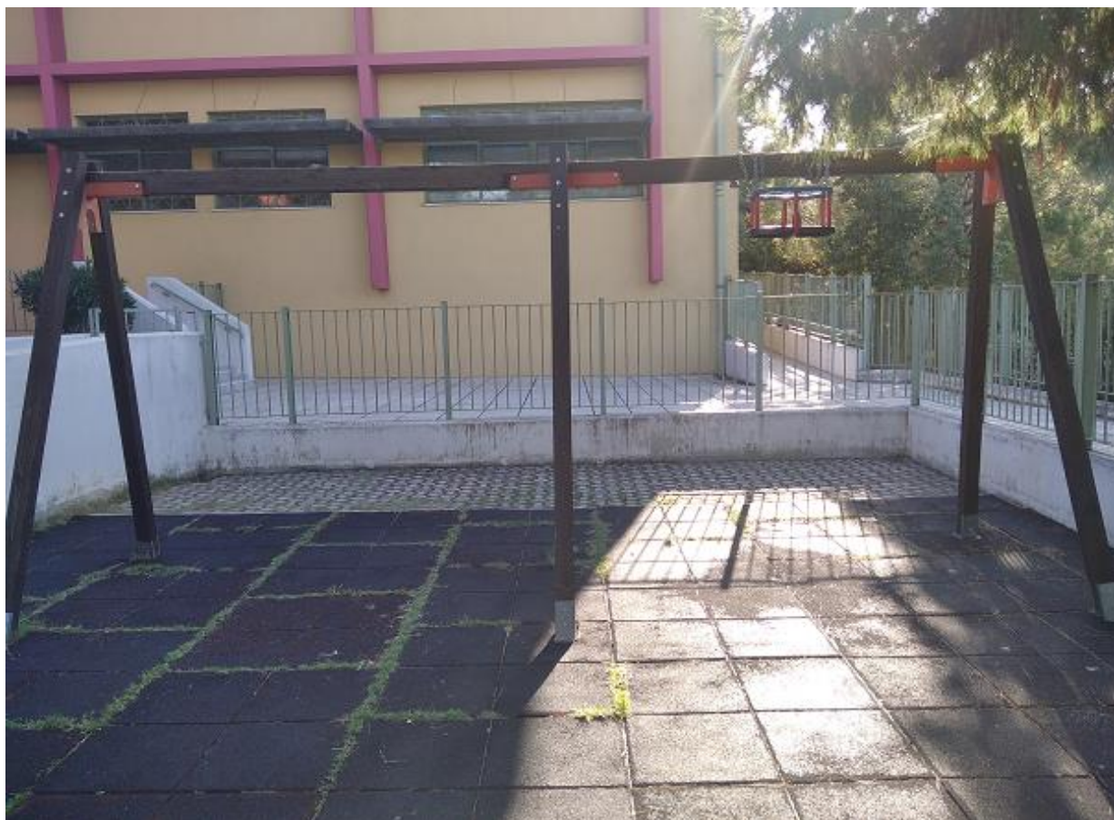
Φωτογραφία 1. Ακατάλληλες κούνιες

- Υπάρχουν μόνο οι σκελετοί, οι οποίοι χρήζουν ελέγχου για να διαπιστωθούν εάν τα ξύλα του σκελετού είναι κατάλληλα. Εάν διαπιστωθεί ότι δεν είναι θα πρέπει να αλλαχθούν. Εάν διαπιστωθεί ότι είναι κατάλληλα και μπορούν να ανταπεξέλθουν στο βάρος και στην ταλάντευση της κούνιας, τότε χρήζουν συντήρησης (ξύσιμο και λείανση για αποφυγή τραυματισμού και λουστράρισμα).