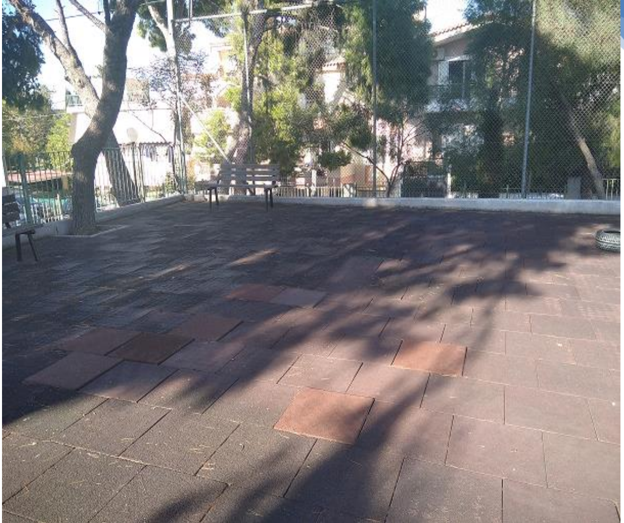
Φωτογραφία 6. Χώρος που ήταν το πολυόργανο