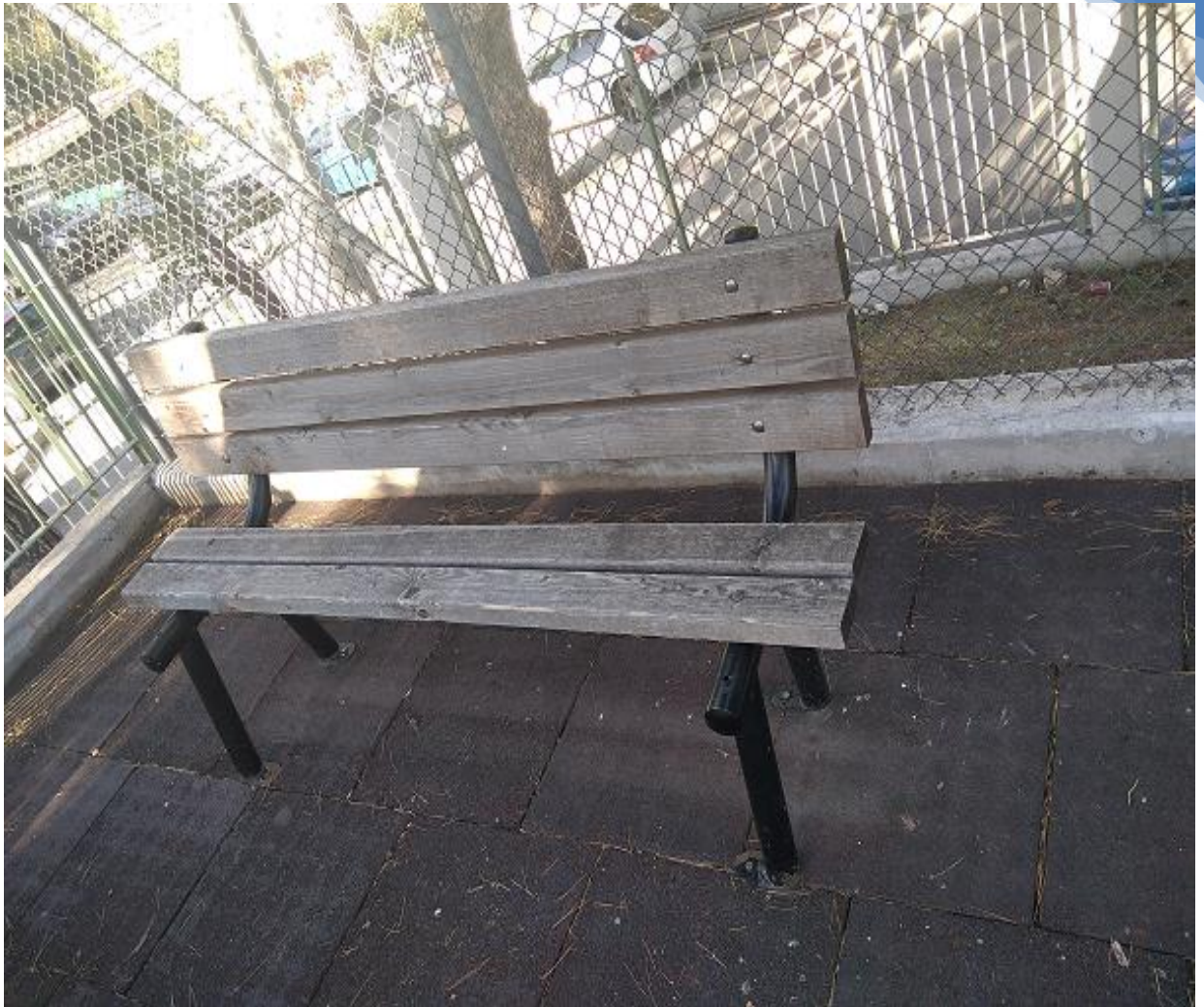
Φωτογραφία 7. Ακατάλληλο παγκάκι, λείπει μία ράβδος

- Οι μπασκέτες (φωτογραφία 8) στο προαύλιο επισκευάστηκαν με δωρεά και τρίφτηκαν, περάστηκαν μίνιο και βάφτηκαν από εθελοντική εργασία γονέων και εθελοντών.