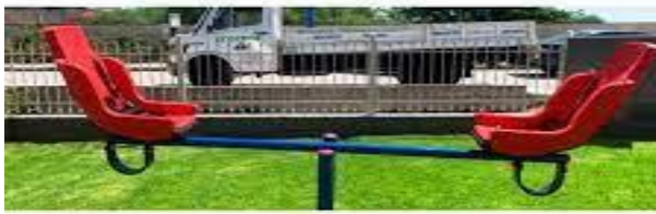
Φωτογραφία 5. Κατάλληλη τραμπάλα

- Το πολυόργανο (ξύλινη κατασκευή που ανέβαιναν τα παιδιά και είχε πλαστική τσουλήθρα και μια μικρή σκάλα), κρίθηκε εντελώς ακατάλληλο , αφού είχαν σαπίσει τα ξύλα και ήταν πολύ επικίνδυνο για τα παιδιά και αφαιρέθηκε τελείως (επισυνάπτεται φωτογραφία 6 με το άδειο πλέον χώρο).