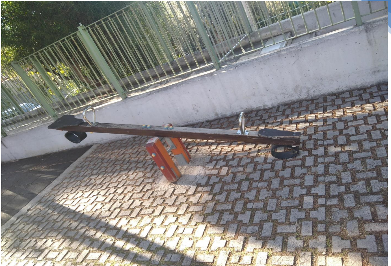
Φωτογραφία 4. Ακατάλληλη τραμπάλα