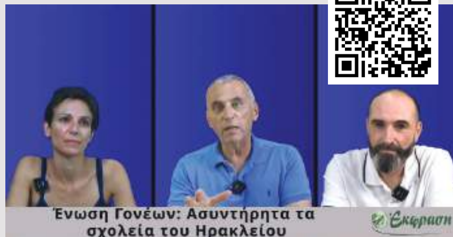
Ένωση Γονέων: Ασυντήρητα τα σχολεία του Ηρακλείου

ανέδειξαν και από αυτό το βήμα την κατάσταση των σχολικών μονάδων, στην προσπάθειά τους να βελτιώσουν την καθημερινότητα των παιδιών και των καθηγητών. «Θα προβούμε σε κινητοποιήσεις αν τα σχολεία δεν ανοίξουν με ασφάλεια», ξεκαθάρισαν.