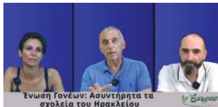
Ένωση Γονέων: Ασυνητήτα τα σχολεία του Ηρακλείου