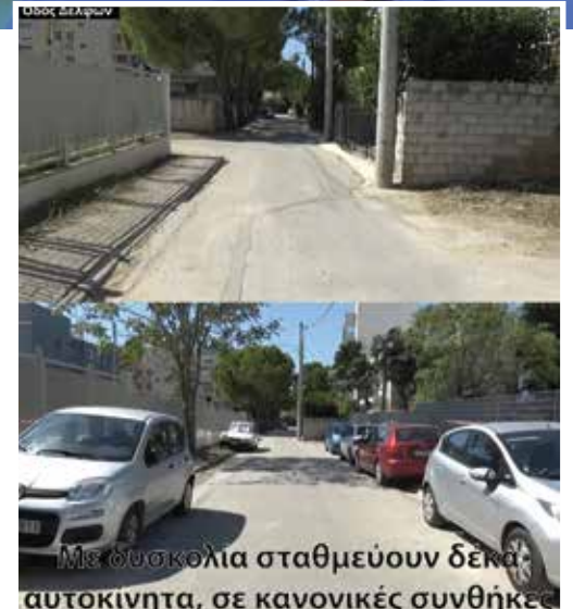
Με δυσκολία σταθμεύουν δεκά αυτοκίνητα, σε κανονικές συνθήκες